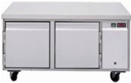
UKTZ 2 mit zusätzlicher Arbeitsplatte und Rollengestell