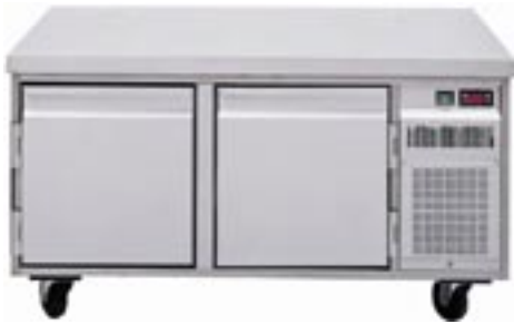
UKTM 2 mit zusätzlicher Arbeitsplatte und Rollengestell