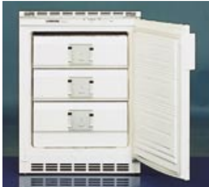
G UW 1223