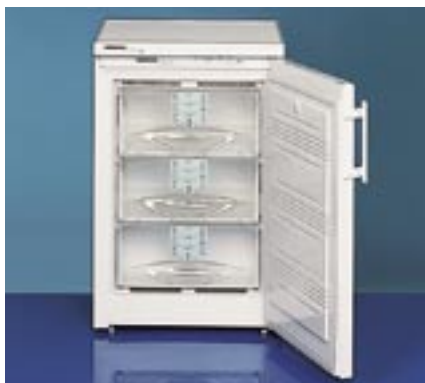
GSN 1023 W