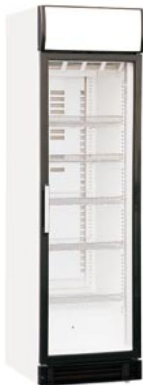
TKU 500 G