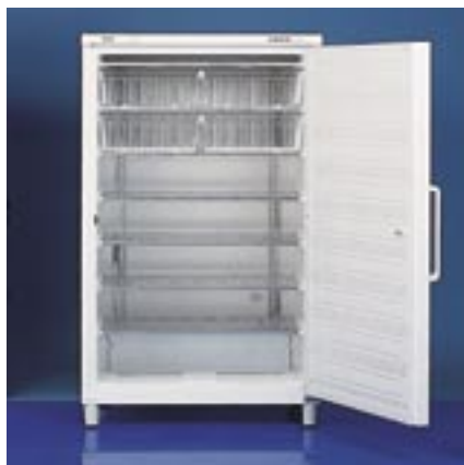
GS 520 W