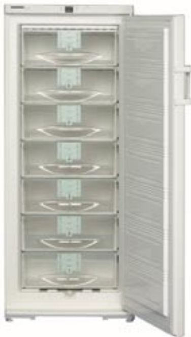
GSS 3123 W