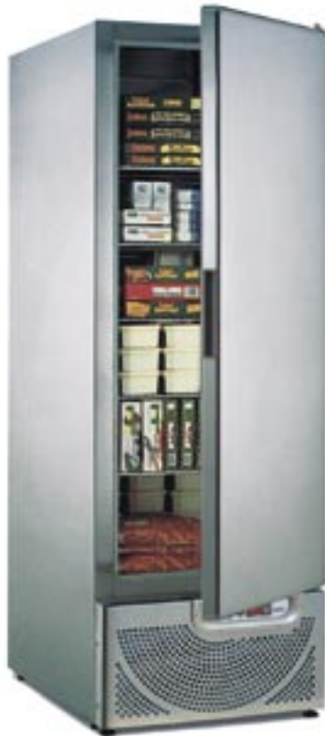
LF 610 U