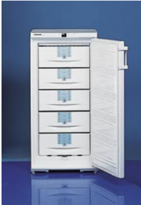
GS 201 W