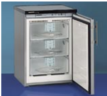
GSN 1023 ES