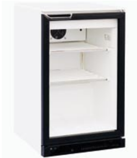
TKU 155 G