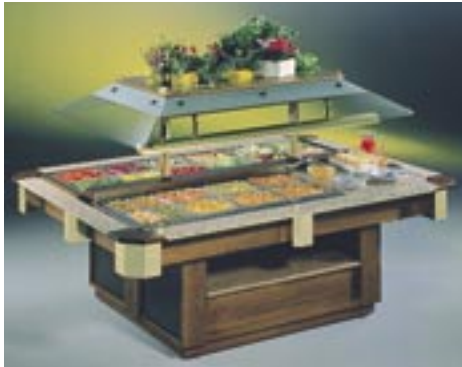
Gran Buffet, Kombination A, Verkleidung Nußbaum dunkel