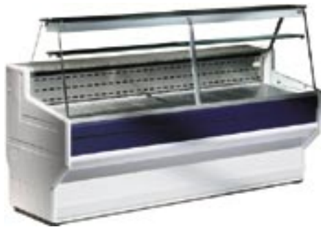
ZVP 03 100 cm